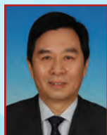
刘燕华 国务院参事 国务院

大数据、互联网、物联网、云科技、人工智能、生物科技等的飞速发展已将人类带入颠覆式创新时代。如何定义创新？驱动力又是什么？刘燕华参事将与大家分享中国创新模式的转型与如何打造创新服务平台。