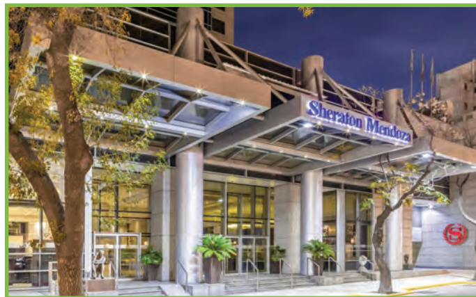
Sheraton Mendoza Hotel Primitivo de la Reta 989 Mendoza, Argentina, 5500

Reserve su habitación en el Sheraton Mendoza Hotel antes del 7 de octubre y recibirá la tarifa especial de USD 150 + VAT (21%), por noche. Si solicita la habitación después del 7 de octubre de 2019, su reservación quedará sujeta a disponibilidad y espacio y se cobraría una tarifa más alta. La tarifa especial es válida 3 días antes y tres días después de las fechas oficiales del evento, e incluye desayuno e internet.